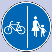
Getrennter Geh- & Radweg