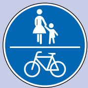
Gemeinsamer Geh- & Radweg